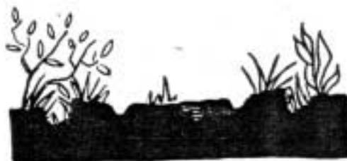
Som de fleste veger nå ser ut.

omgivelsene, er først å slå gresset langs vegkantene utenfor sine eiendommer samt flå av gresstorven på vegkantene og renske opp grøftene. Vi vil da unngå at regnvannet flommer i vegene og lager grøfter i hjulsporene. Slik det nå er mange steder, har overvannet ingen muligheter for å komme ut i grøftene. Dette arbeide vil også vellet støtte opp om så langt det evner.