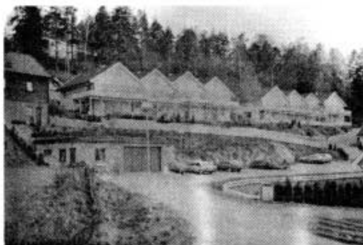
Vi lar de relativt nye husene i Bakkegårdsveien representere Oksval. Vårt vel inneholder bebyggelse i alle aldre og danner et allsidig miljø for oss Oksvalboere.

Til Gislestranda var det en kronglete adkomst ned fra Badeveien. Selve stranda var det interessant å få greie på - men barnevennlig var den ikke. Stranda bar ellers preg av å være utgangspunkt for stor fiskeaktivitet. På veien oppover fikk vi en lengre og hyggelig samtale med herr/fru