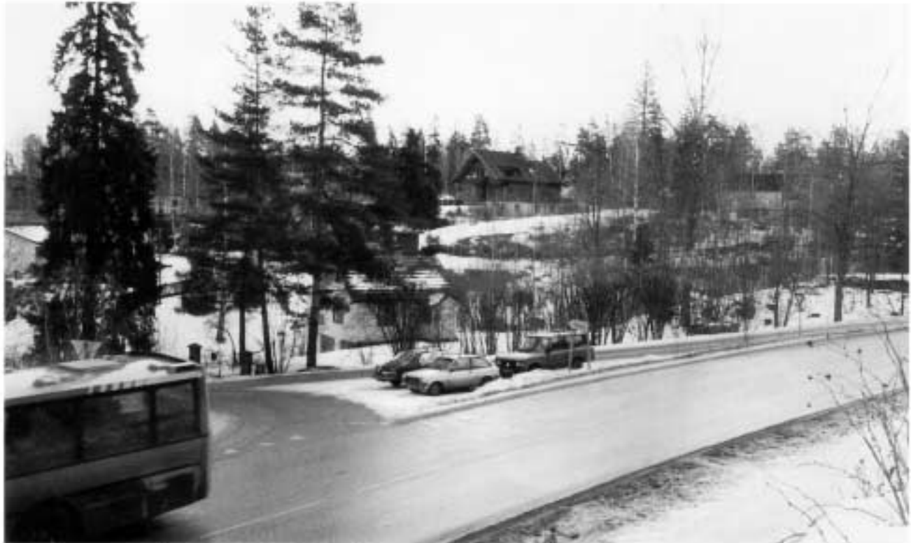
Oksvalkrysset – må det en ulykke til for å få fart i utbedringen?