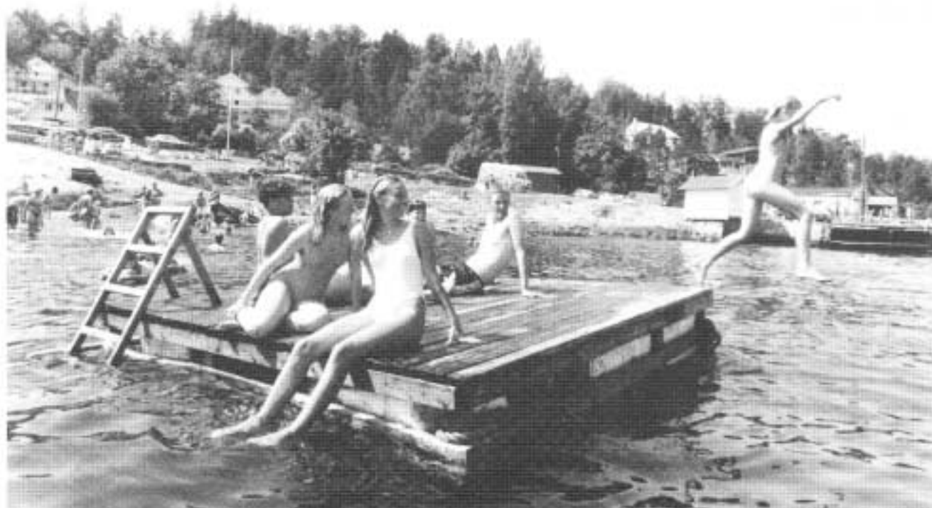
Strandlivet går sin gang - til tross for ufine interjører fra lokalavisen.

ding fra oppsittere om hvor det trengs å flikkes på med subbus og grus - slik at vi kan ta en felles innsats til felles glede.