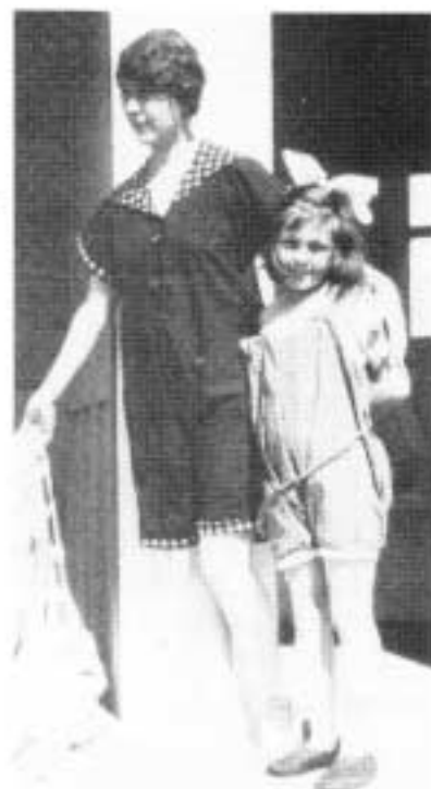
1921: Mor og datter klargjøres for badning fra firkantet sprinkelkasse heist med talje og kjetting - med moteriktig badekonfeksjon fra første verdenskrig. Badedraktene blir stadig kortere. Når ser vi enden?" heter det i vellets beretning.

firkantete innretninger som kunne fires og heises ved hjelp av trinsearrangement med kjettinger. Damene måtte passe seg vel for nysgjerrige og frekke mannfolk som forsøkte å kikke på dem. For noe av det verste som kunne hende var at en dame i badedrakt ble iaktatt av "skapningens herre".