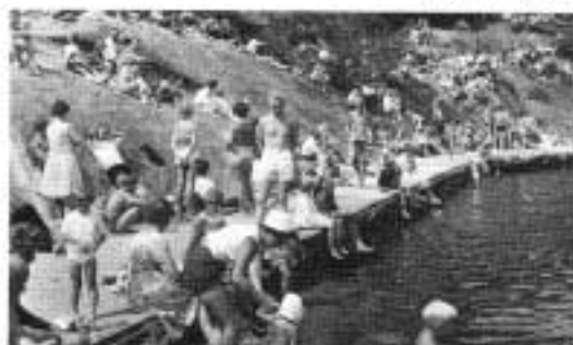
Nesoddmesterskapet i svømming på Ursvikstrand i 1964.