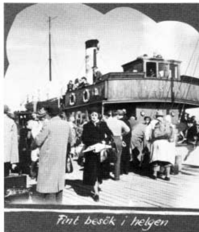
Tint besøk i helgen

Før krigen og et godt stykke senere lå Nesodden liksom mye lenger fra byen enn den gjør i dag. Du kunne snakke om det