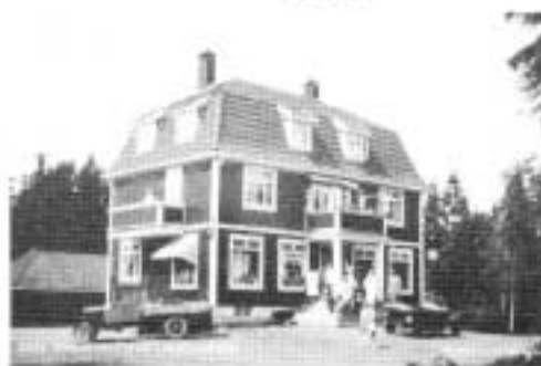
I følge vellets hovedredaktør i 1979 ble huset bygget i 1925. Men dette fotografi et fra J.H. Kjenholdt skal være tatt allerede i 1915

- Den nuværende Støps vei var en kort veistump som fortsatte i en skogsti.