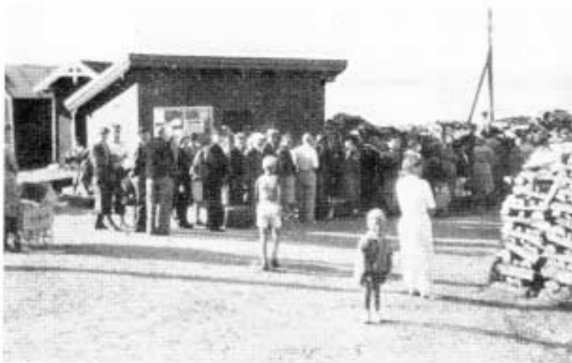
1944: Kødannelse og vedopplag er karakteristiske trekk i bryggeområdet. I mangel på annet drivstoff fyrte båtene med ved

Oksval ble under siste verdenskrig 1940 - 1945 hjemsøkt av bomber, som forårsaket skader på hus, dog ikke av særlig stor betydning, men å rengjøre huset etter glassplinter var et stort arbeid.