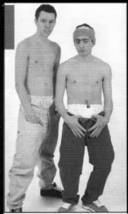
Glimt fra Bernhard Sports postordrekatalog

for oss er å ha troverdighet innenfor denne kulturen og dette miljøet. Store glatte annonser med arrangerte modellbilder gir ikke troverdighet. Derimot så reiser vi mye ut i felten hvor ting skjer. Akkurat nå deltar vi med et team under det åpne svenske mesterskapet i Stockholm, og vi har stand på "Totally freaked out"-delen av hjem & hobby-messen på Sjølyst. I tillegg har vi en snøbrett-ekspert i USA.