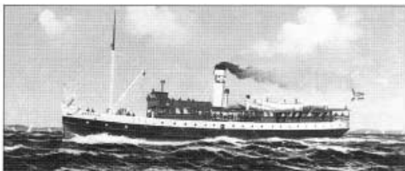
D/S Oksvald fikk siden fornavnet M/S og ble landets første flytende diskotek i 1970 Maleri: M. Haug, Oslo

D/S Oksvald viste seg å være en meget god og nyttig tilvekst til selskapets flåte. Skipet var i den første tiden Bunnfjordens flaggskip, ført av skipper Hans Strøm.