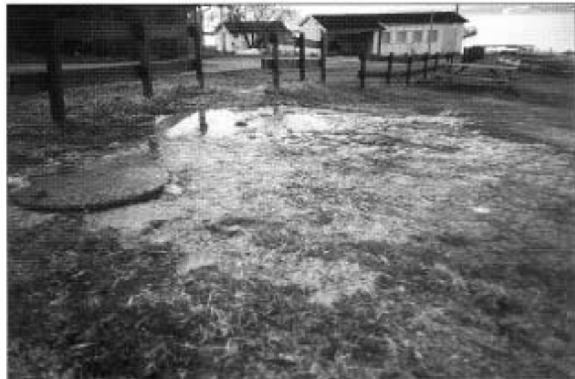
Slik ser det ut på det verste. Kummen er tett og kloakk strømmer fritt over gressplenen og ned til stranda. Bildet er tatt i påsken. Kloakken strømmet ut en halv dag før forholdene ble utbedret. Heldigvis skjer ikke dette så ofte. Hovedproblemet er kloakk som siger ut fra grunnen og ut på stranda

Det kommunale ledningsanlegget ble rehabilitert i 1986-1988 fra