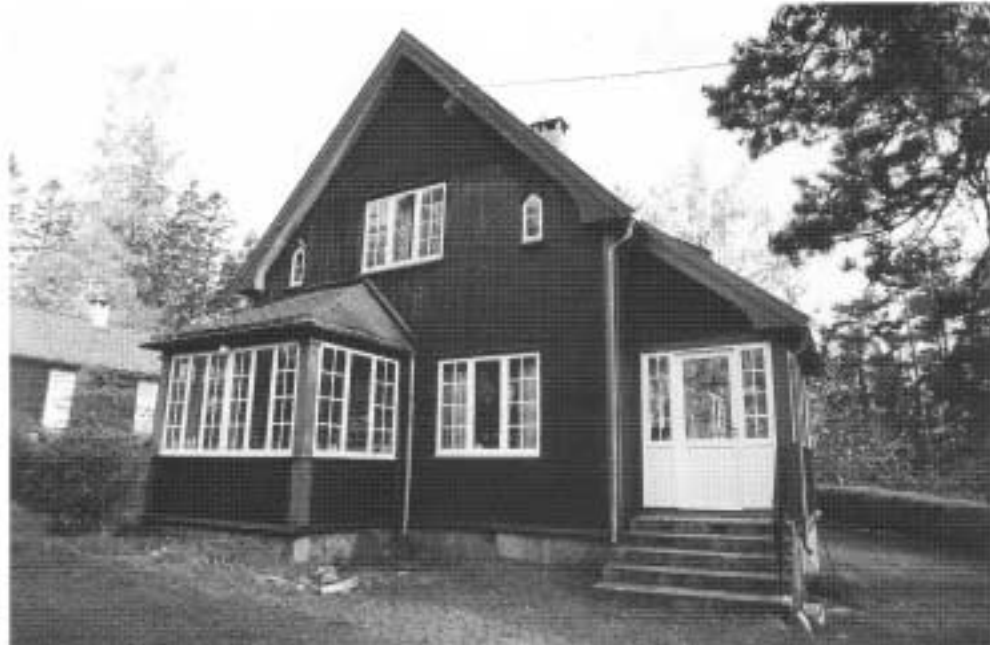
I vår vandring rundt i Oksval er vi kommet til "Toppen", et av få hus som er holdt i sin opprinnelige byggestil.